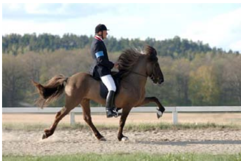
Vignir & Ísar frá Keldudal